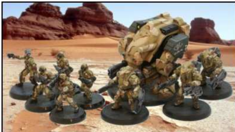
White Stars lors de la campagne Desert Storm – Figurines par Feldhorn