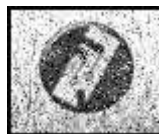
Le cliché ci-contre semble représenter un symbole Therian sur un morceau de métal.

Tout laisse à penser que Mortis est au cœur d'un vaste conflit.