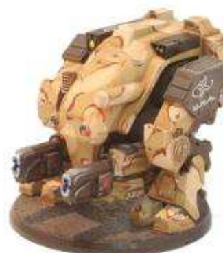
Figurines visibles au magasin Dreamweij

Toujours plus de profits, toujours plus d'argent. Tel semble être le crédo des UNA avec le lancement de la campagne Desert Storm . L'objectif inavoué de Central Command est tout simplement de s'emparer des riches gisements de quartz et de silice exploités par les Therians.