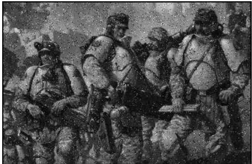
Premières images de la tête de pont du Red Blok sur Damoclès

Car contrairement à l'optimisme affiché dans les colonnes du New Eden Times ou de l' Ava Daily , la guerre sur Damoclès