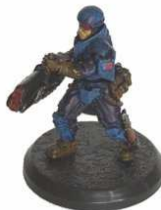
Fantassin des forces Galianes

Depuis lors, UNA et Red Blok se livrent une véritable guerre froide pour tenter d'élargir leur influence respective sur