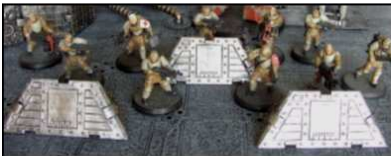
Sur Damoclès, des soldats se mettent à couvert derrière des murets

En termes de jeu, les murets doivent être considérés comme ceux fournis par Rackham.